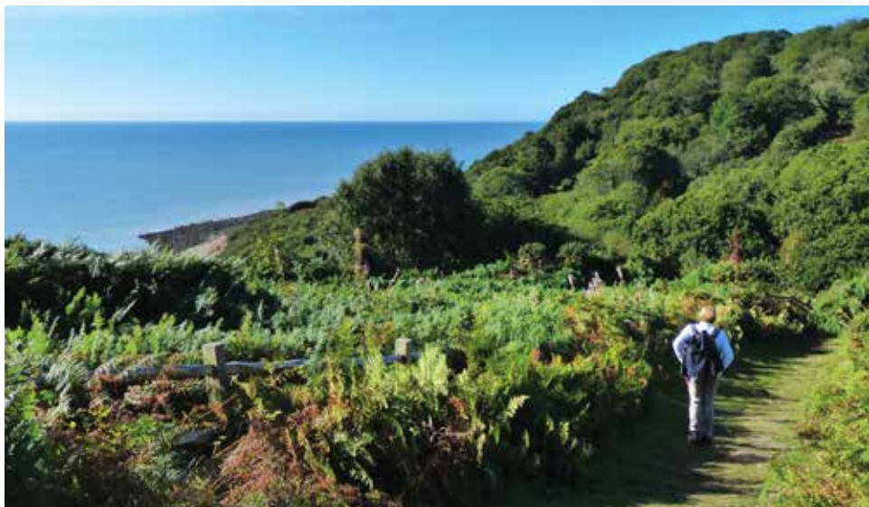
Wandelen langs de beboste kliffen bij Hastings.

Aan de overzijde bevindt zich the Old Town, de oude stadskern met zijn rijk maritiem verleden en een overvloed aan fish-and-chips eetuisjes. Georges Street kaapt met voorsprong de prijs van de gezelligste straat weg. Je vindt er een charmante mix van in hout opgetrokken huizen en 'twittens', nauwe doorgangen waarin pubs, antiekwinkels en restaurantjes zich schuilhouden. De East Hill Cliff Railway (voor de liefhebbers is er ook een West Hill Cliff Railway) nemen, is voor vele Engelsen een reisdoel op zich. De steilste lift van het Verenigd Koninkrijk brengt je in geen tijd van het strand naar de kliffen met spectaculaire uitzichten over de oude stad en de zee.