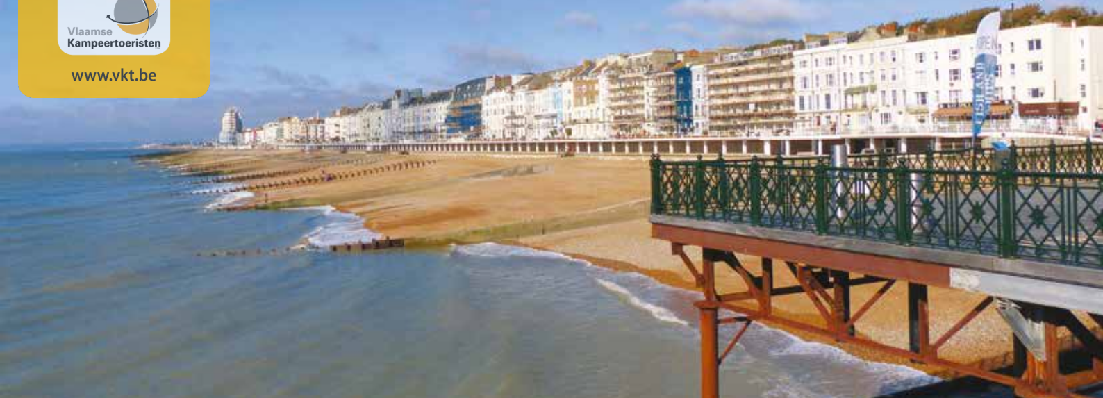
Het strand van Hastings met zijn chique boulevard.