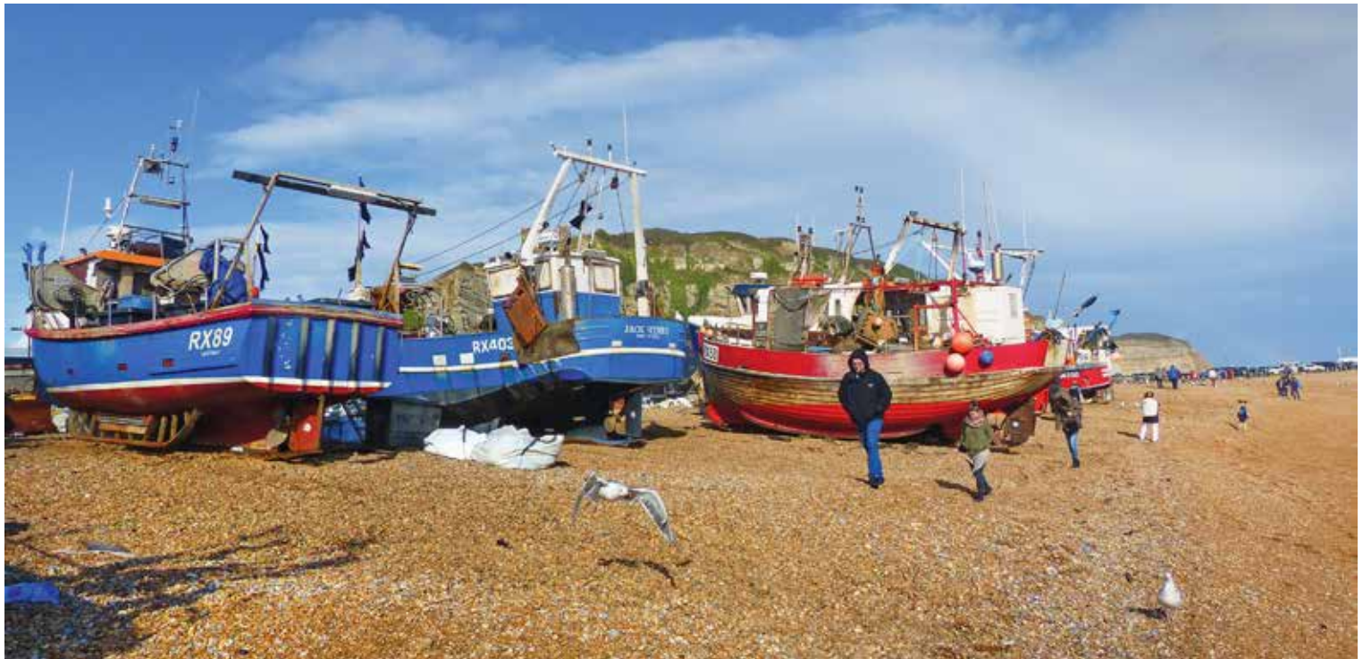
Vissersboten parkeren op het keienstrand the Stade van Hastings.