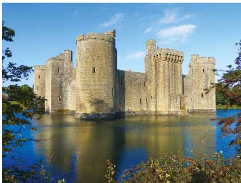
Veilig achter de slotgracht laat Bodiam Castle de wolken en de eeuwen voorbij glijden.

De combinatie van mooie natuur met levendige geschiedenis maakt van Oost-Sussex een boeiend reisdoel. Naast de rijkdom aan bezienswaardigheden en leuke plaatsen ontmoet je er soms een tikkeltje excentrieke persoonlijkheden waarvan je dacht dat ze alleen in Britse televisieseries voorkomen. Je kan er verdwalen in een doolhof van kronkelende weggetjes tussen eindeloze hagen en bomenrijen. Vooral niet vergeten links te houden wanneer je je op de baan begeeft. Want die typisch Engelse geplogenheden heeft zelfs Willem de Normandiër niet kunnen verijdelen ... ■