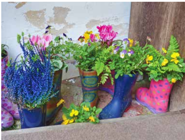
Kinderlaarsjes vol bloemen, een originele verwelkoming in de stemmige Anglicaanse kerk van Herstmonceux.