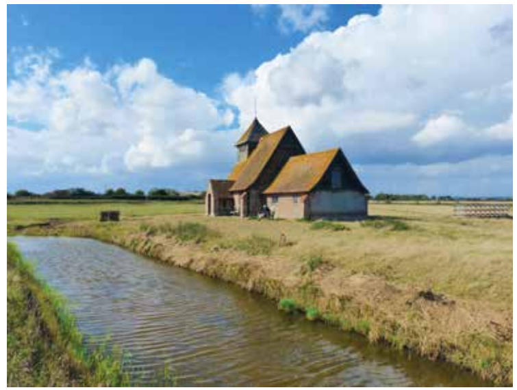
In het midden van een grenzeloos landschap staat het oude kerkje van St. Thomas Becket.