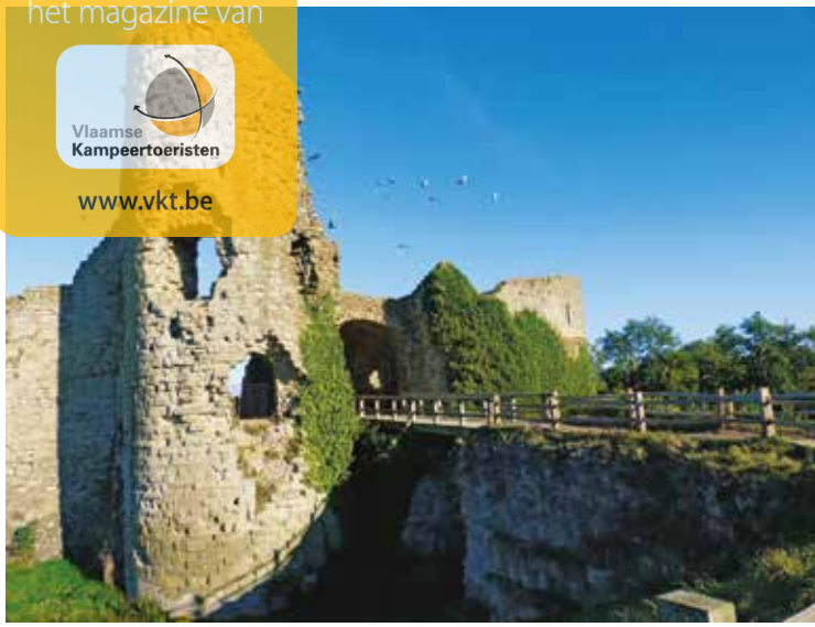
Dit is wat rest van de eerste Normandische burcht op Engelse grond in Pevensey.