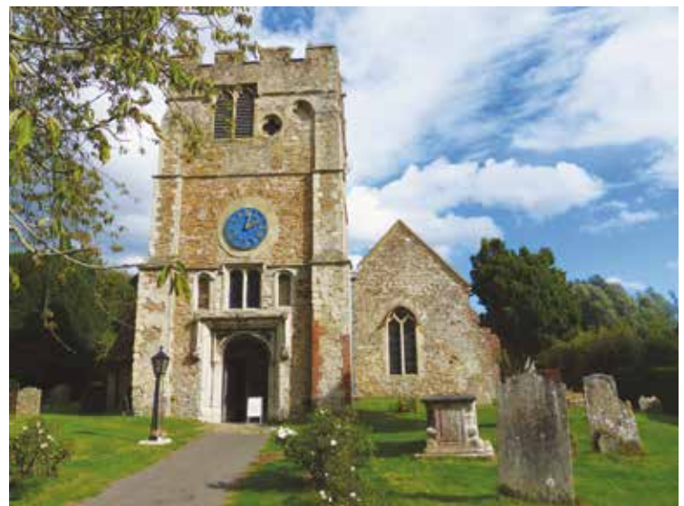
De Sint Petrus en Pauluskerk van Appledore heeft meer weg van een versterkte vesting dan van een kerk.