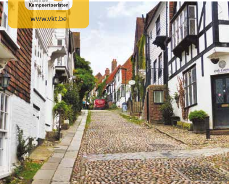
De straten van het oude centrum in Rye zijn niet bepaald fietsvriendelijk.