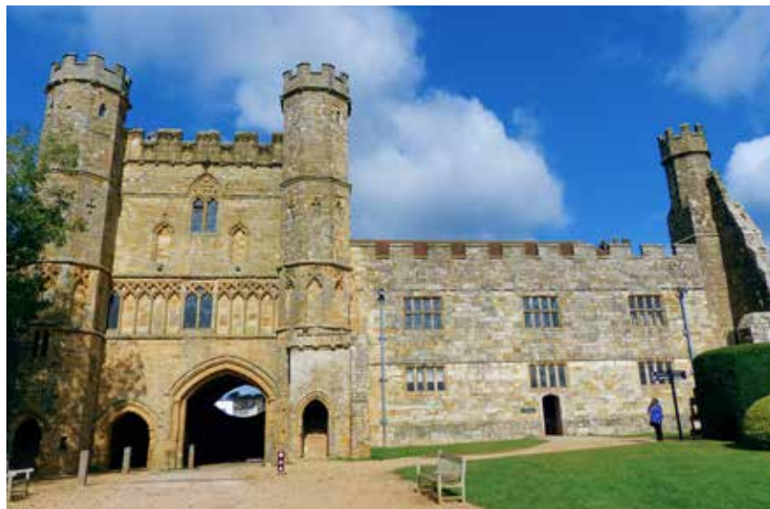
Willem de Veroveraar liet in Battle deze abdij bouwen op de plaats waar in 1066 de beroemde slag plaatsvond.

De noordelijke fietsweg 1066 circular verbindt het vlakke kustland met de beboste heuvels van de Weald. Met enige verbeelding herken je in deze benaming het Nederlandse woord woud. Toen Willem arriveerde, was de streek het dichtst beboste gebied van Engeland. Nu is het een landschap van golvende heuvels, een lappendeken van velden, weiden en bossen dooraderd met hagen en holle wegen. De Oast houses, waarin de hop werd gedroogd, steken trots hun spitse, witte daktorens boven de bomen uit.