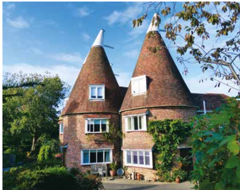
Overal in Hastings Country vind je nog de typische Oast Houses waarin de hop werd gedroogd.