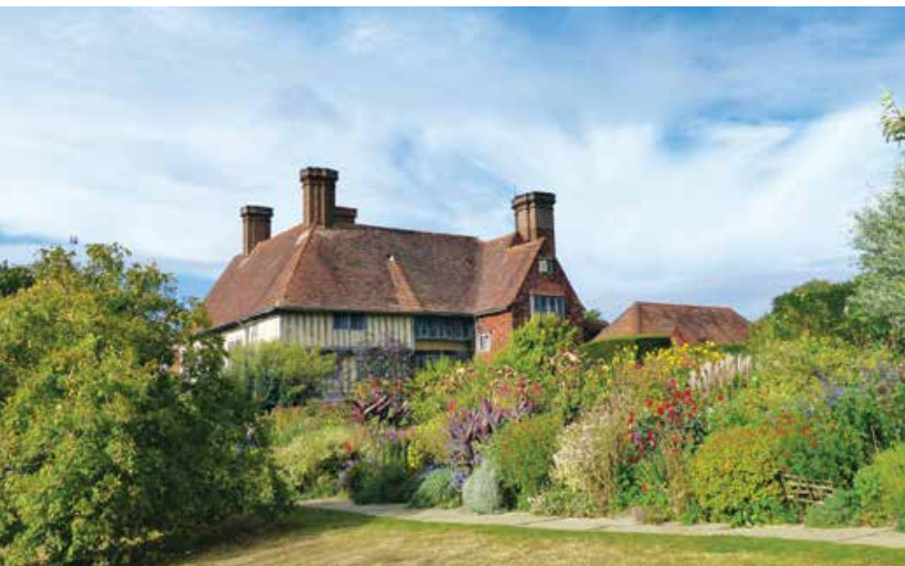
Het Great Dixter Manor House bij Northiam: een indrukwekkend herenhuis verpakt in een ruiker bloemen.