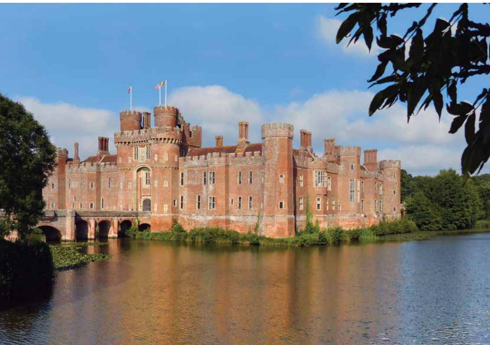
Herstmonceux Castle, een van de eerste bakstenen vestingen van Engeland.